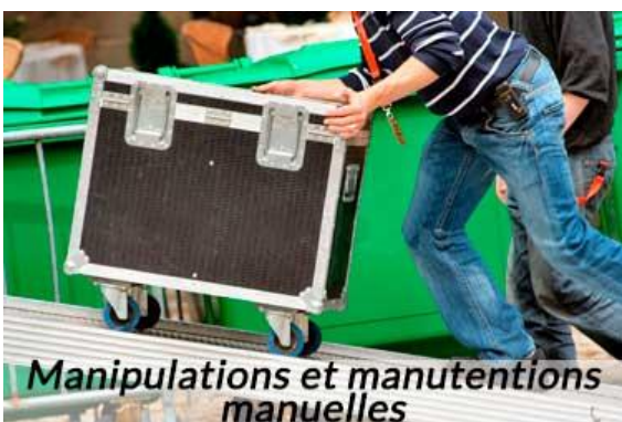
Manipulations et manutentions manuelles