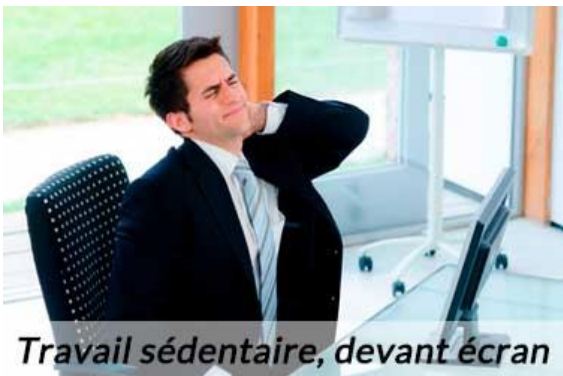
Travail sédentaire, devant écran