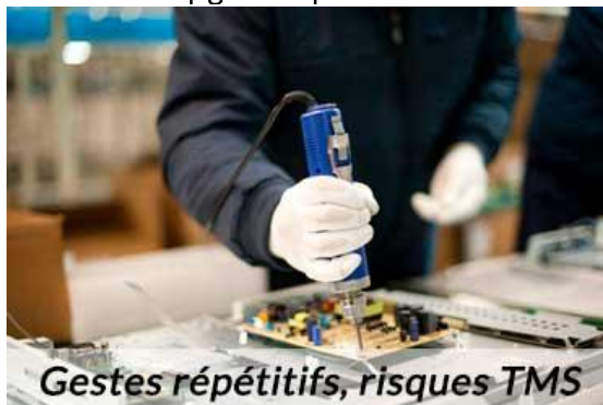
Gestes répétitifs, risques TMS