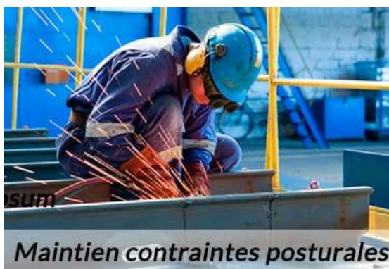
Maintien contraintes posturales