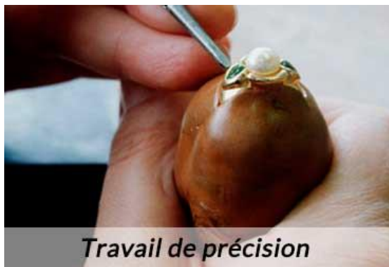
Travail de précision