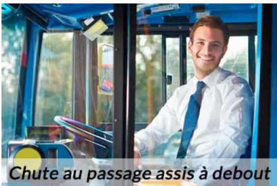
Chute au passage assis à debout